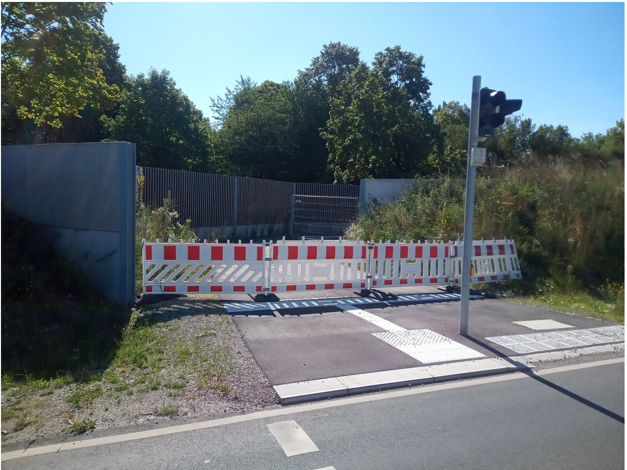
Fertiger Durchgang ist vorsätzlich versperrt ...