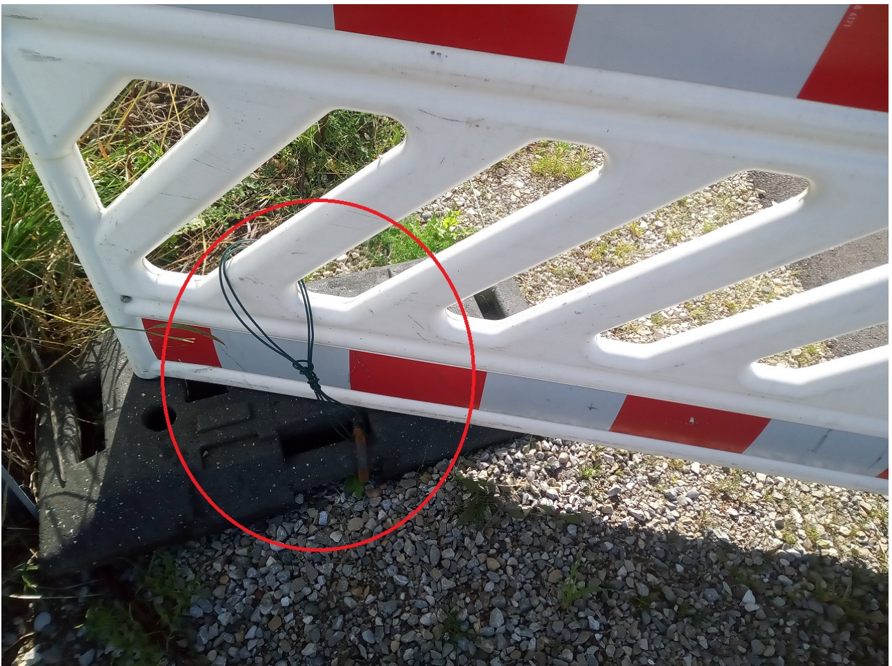
... mit großem Ideen und Materialeinsatz ...