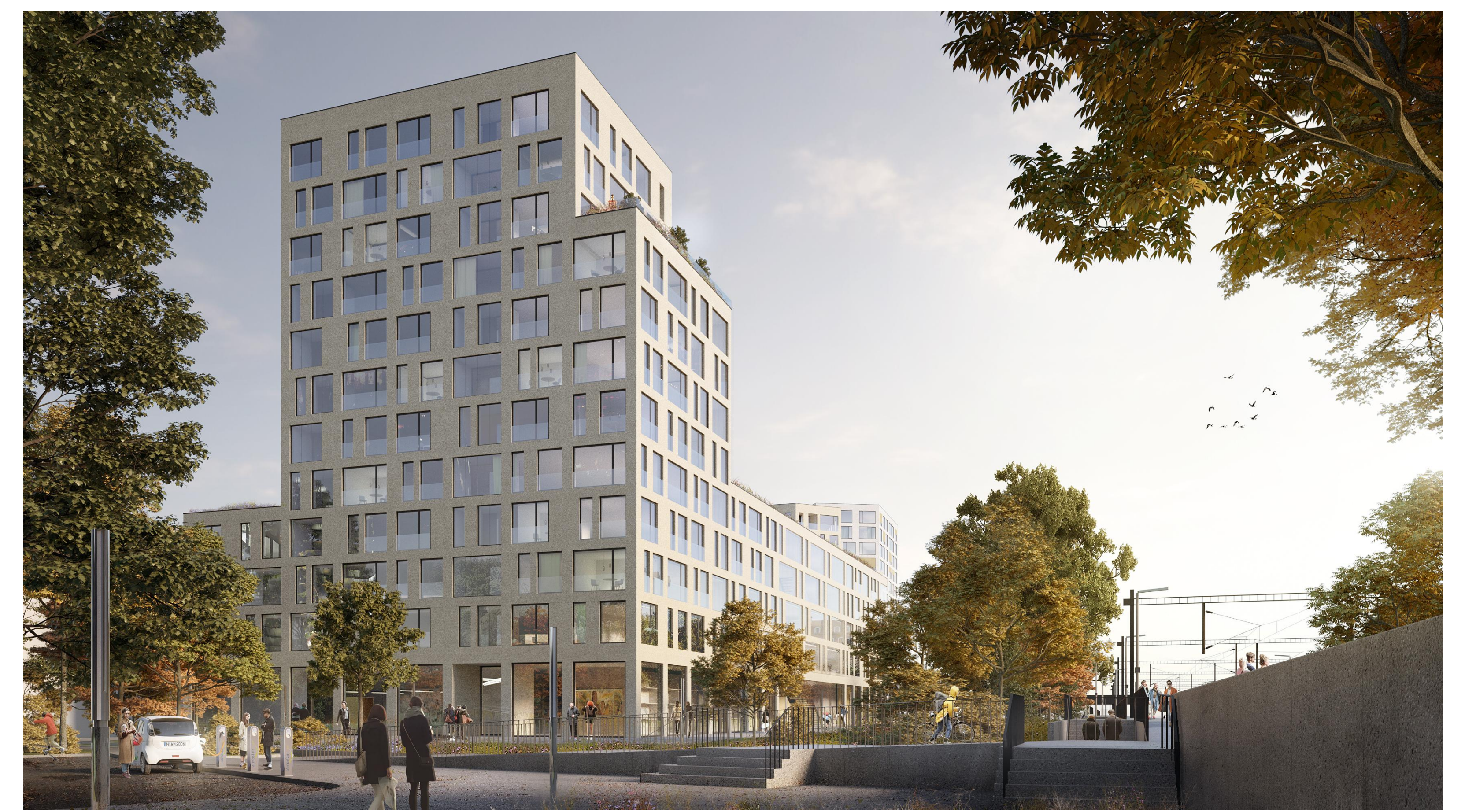
Visualisierung - Standpunkt S-Bahn-Parkplatz Nord, Variante Fassade