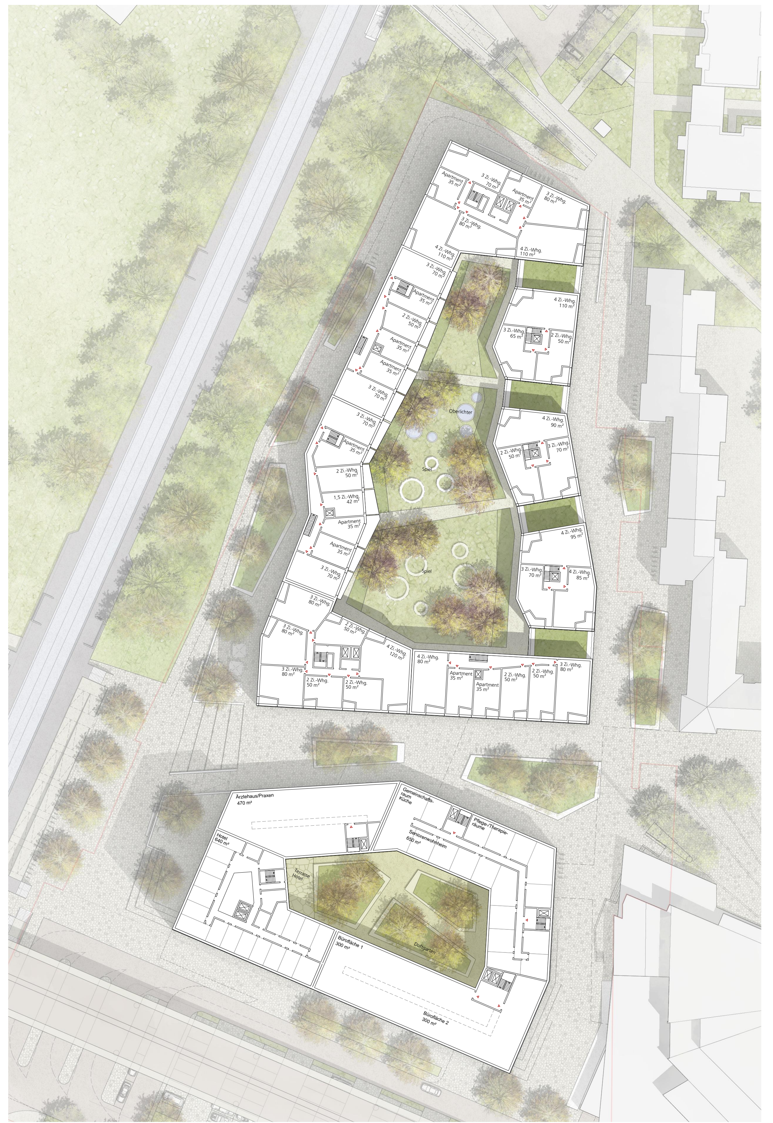
Vertiefung Regelgeschoss M 1:500