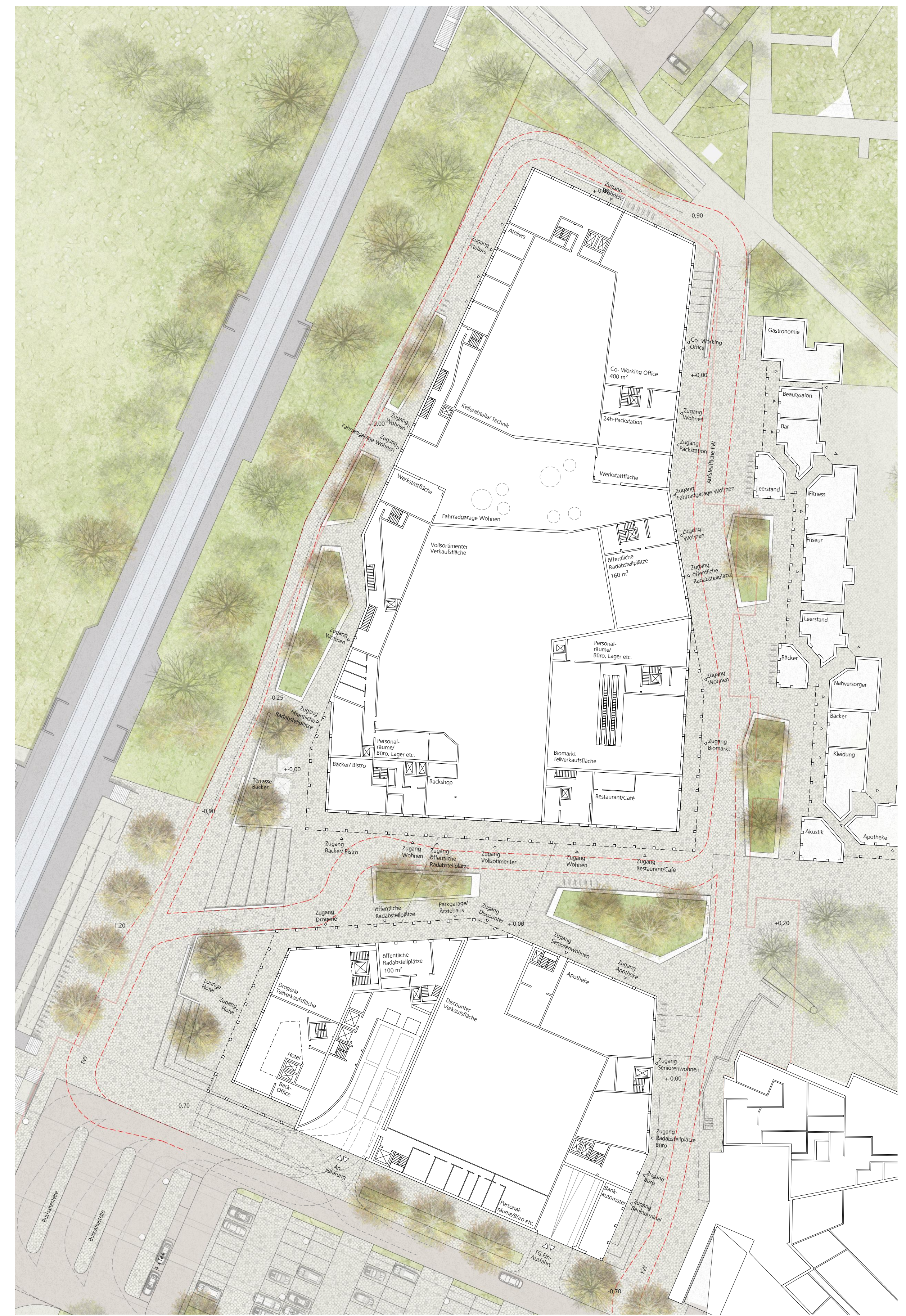
Vertiefung Erdgeschosszone M 1:500