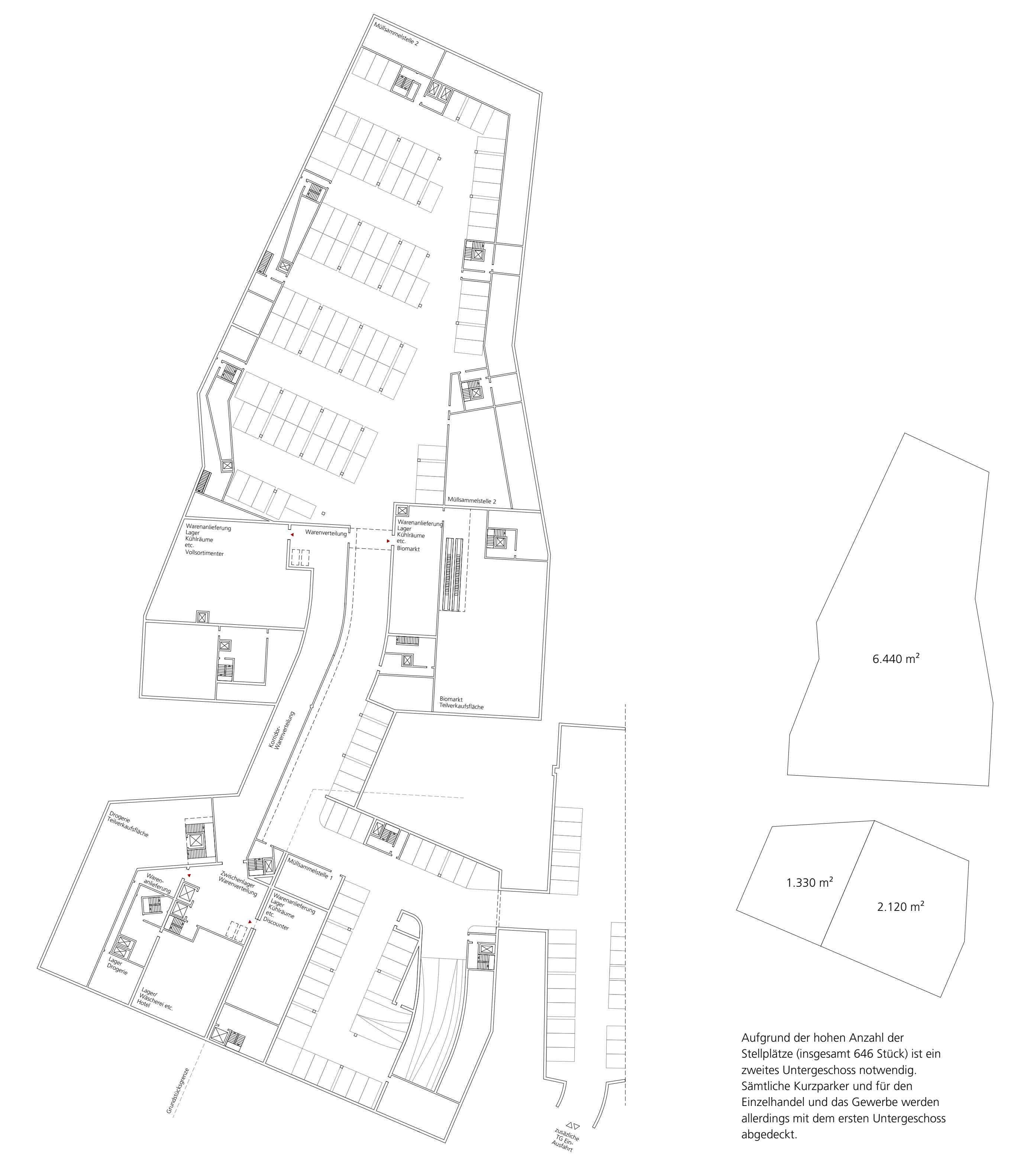
Vertiefung Untergeschoss 1 M 1:500

Aufgrund der hohen Anzahl der Stellplätze (insgesamt 646 Stück) ist ein zweites Untergeschoss notwendig. Sämtliche Kurzparker und für den Einzelhandel und das Gewerbe werden allerdings mit dem ersten Untergeschoss abgedeckt.